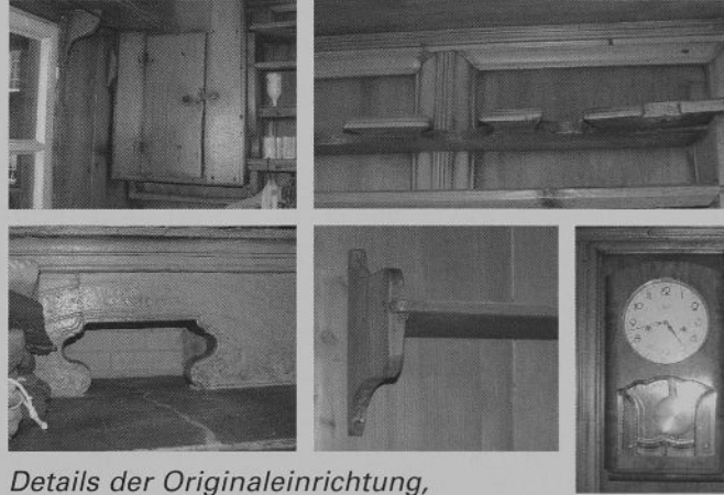
Details der Originaleinrichtung, wie sie noch heute vorhanden ist

dem Jahr 1891 restaurieren. Auch die Einrichtung wurde sorgfältig geordnet und bei Bedarf repariert.